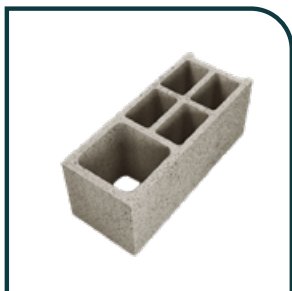
BLOC D'ANGLE - CHAÎNAGE VERTICAL Dimensions : 50 x 20 x 20 cm Poids / pièce : 19 kg Poids / palette : 1 350 kg (70 blocs par palette)