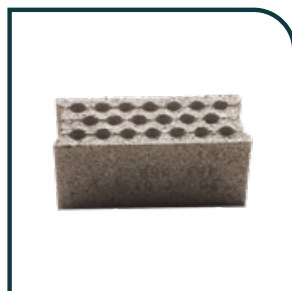
BLOC SEMI-PLEIN Dimensions : 50 x 20 x 20 cm ( 27 kg ) ou 50 x 15 x 20 cm ( 26 kg )