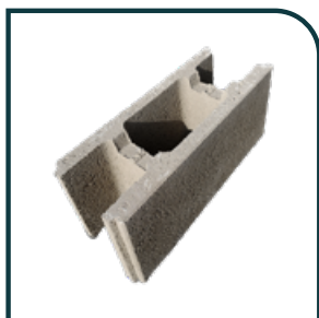
BLOC À BANCHER Dimensions : 50 x 20 x 20 cm Poids / pièce : 19 kg Poids / palette : 1 150 kg (60 blocs par palette)